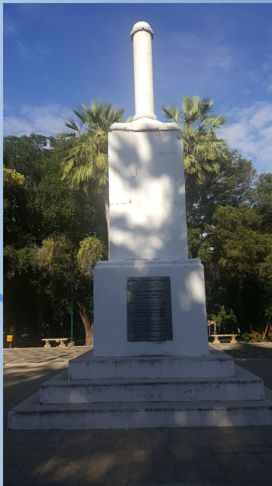
Marco de Teresina. Praça Marechal Deodoro (Praça da Bandeira).