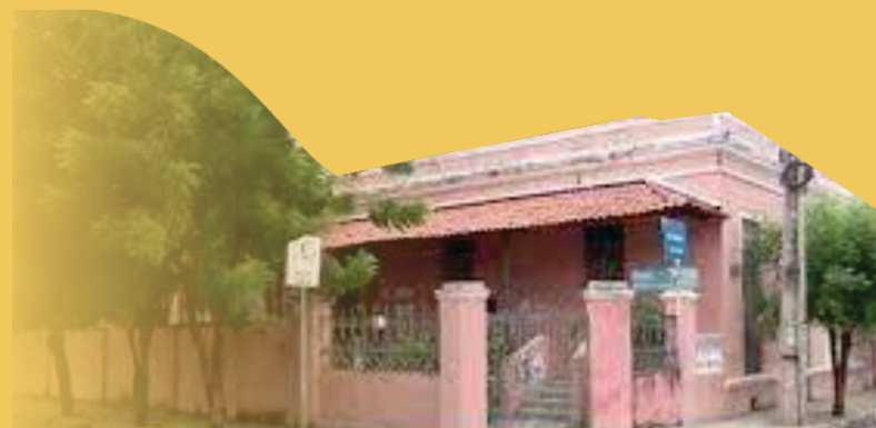
Casa da Cultura Dona Carlotinha

A colonização piauiense se deu pela região sul do Estado, quando os desbravadores do século XVII penetraram o interior do país e se espalharam por Goiás, Minas e Bahia, chegando ao Piauí sob o comando do português Domingos Afonso Sertão. Em 1718, a então Vila da Mocha, antiga Fazenda Cabrobró (hoje cidade de Oeiras), instalada às margens do Riacho da Mocha, passa à condição de capital do Piauí. Em outubro de 1851, o Presidente da Província, José Antonio Saraiva, transfere a sede da Vila do Poti, em Teresina (hoje Poti Velho), para a Chapada do Corisco, nascendo daí a Vila Nova do Poti, futura capital. Em 21 de julho de 1852, a Lei Provincial 315 eleva a Vila Nova do Poti à categoria de cidade, com o nome de Teresina, em homenagem, à Imperatriz Teresa Cristina, esposa de Dom Pedro II. No dia 16 de agosto do mesmo ano, José Antonio Saraiva oficializa a mudança aos demais presidentes de província e passa a governar da nova capital.