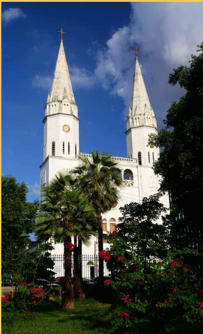
Igreja de Nossa Senhora do Amparo.

Teresina, eterno raio de sol: manhãs de claro azul no céu de anil; és fruto do labor da gente simples, humilde, entre os humildes do Brasil!