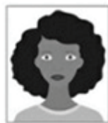
Figura 1. Modelo de Foto Frontal