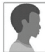
Figura 2. Modelo de Foto de Perfil

III- um vídeo individual recente (com, no máximo 30MB, exclusivamente no formato MP4 e de até 30 segundos de duração), contendo resumidamente sua autodeclaração, a qual o candidato deverá iniciar dizendo: